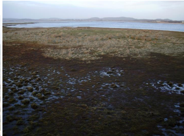
Getteröns natura 2000 område