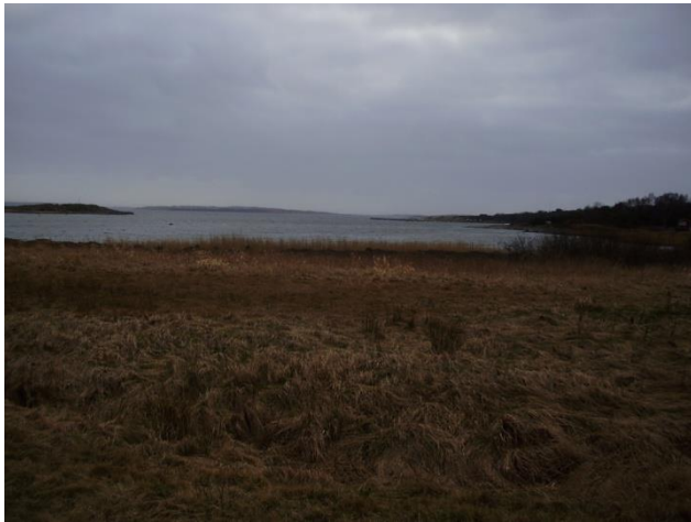
Vendelsöfjorden utanför Löftaån

Vendelsöfjorden är ett marint reservat med ålgräsängar innanför Vendelsö-Almö och längs landsidan från Stavder mot Espenäsudde i Vendelsöfjorden rinner Löftaån ut, utan tvekan påverkas ålbeståndet i Vendelsö och Åsafjorden av vattenintaget och värmeväxlarna på Ringhals kärnkraftverk.