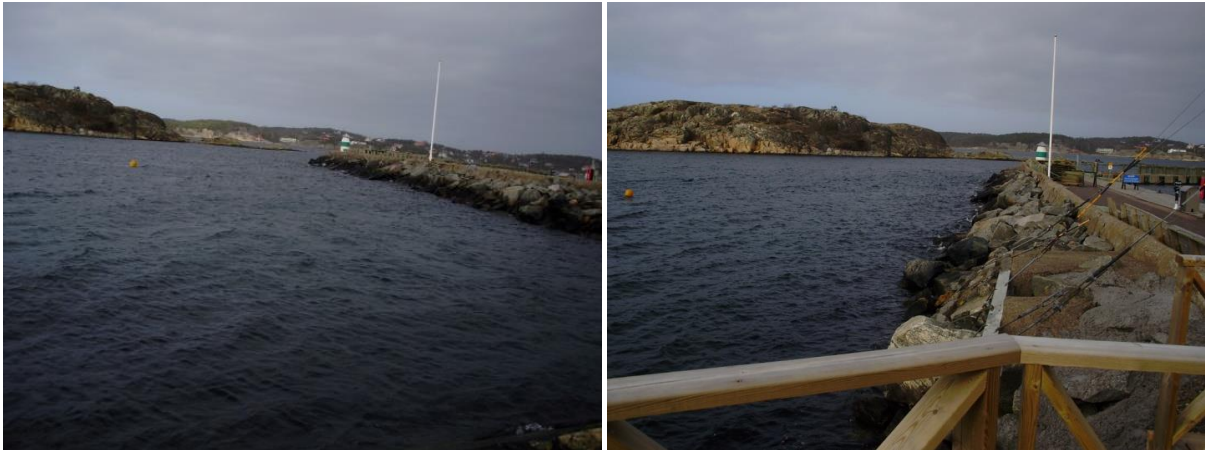
Inloppet till Vallda Sandö

Ålgräsängarna innanför natura 2000 området Vallda Sandö brukar räknas som Hallands största sammanhängande ålgräsängar. På Vallda sandö ligger en stor småbåtshamn som byggts ut i omgångar. Vid den senaste utbyggnaden motsatte sig fisket en utbyggnad eftersom det hade varit mycket bottendöd i området. Fisket krävde att vattencirculationen tillgodosågs, lösningen blev att Vallda Sandö hamn fick betala 35 000 om året i en dom (fiskevårdsavgift), en lösning som miljödomstolen tagit initiativ till. Ersättningen för den skada som blev är försumbar i sammanhanget.